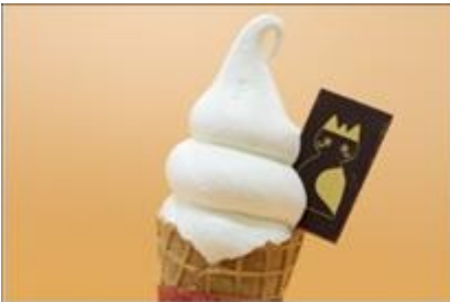
Mokomoko milk soft serve 400yen

Kobe en Ashiya waren de meest vriendelijk steden voor vreemdelingen 50 jaar geleden. Alle consuls woonden er. De stad met de eerste westese restaurants en winkels waar je zelfs gouda kaas kon kopen. Heel vriendelijke streek en zeer vooruit strevend.