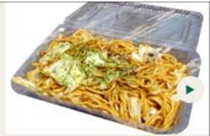
Fried noodles 550yen