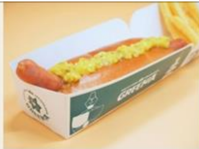
hot dog 650yen